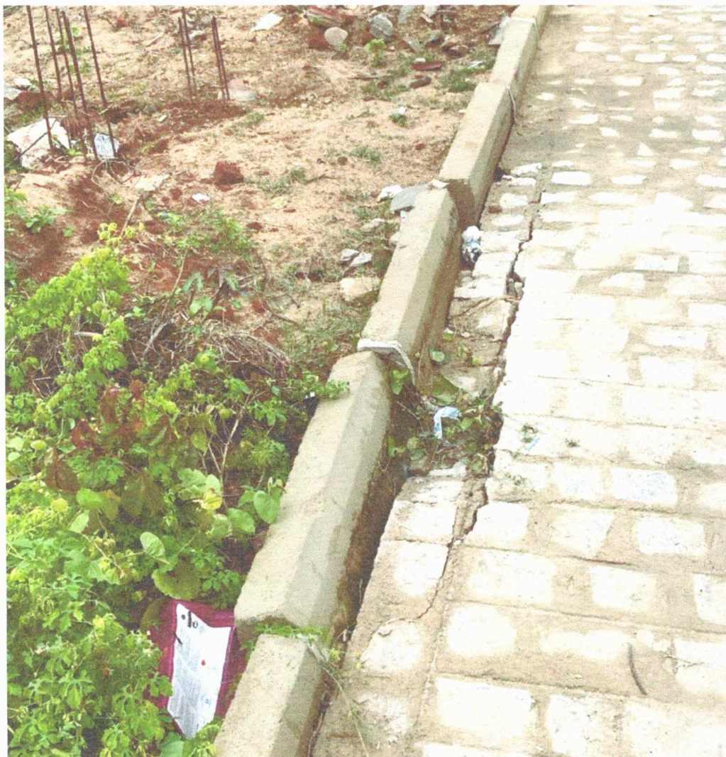
Arquivo do autor - 31/07/2025