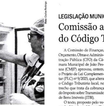
Medida alcança todas as unidades que são geridas pelo Estado

A iniciativa também busca reduzir a morbidade e a