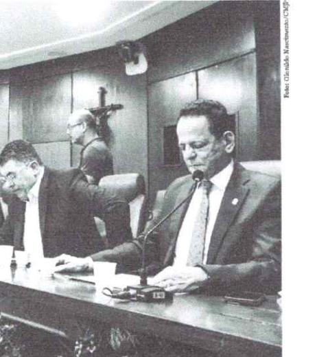
Na reunião de ontem, os vereadores apreciaram 29 matérias legislativas de autoria do Executivo e de parlamentares

A Comissão de Constituição, Justiça, Redação e Legislação Participativa (CCJ) da Câmara Municipal de João Pessoa (CMJP) votou favorável ao instrumento de fruição pública em João Pessoa, matéria do Executivo Municipal que tem o objetivo, segundo o órgão, de estimular e melhorar a oferta de áreas qualificadas para o uso público que privilegiam o pedestre e promovam atividades com valor social, cultural e econômico. O texto foi apreciado na reunião de ontem, com outras 28 matérias legislativas. De acordo com o Projeto de Lei Ordinária (PLO) nº 2117/2024, a fruição pública corresponde à área de propriedade particular localizada nos pavimentos de acesso direto ao logradouro público, destinada à ampliação da área de circulação de pedestres, não sendo de uso exclusivo dos usuários e moradores. Ainda de acordo com a proposta, as áreas poderão receber mobiliário urbano e outros tratamentos, como: área de recreação infantil, espaço para animais domésticos, fontes, espelhos d'água, estação de manutenção de bicicleta, bebedouro, quadra ou meia quadra esportiva, mesa de jogos ou de piquenique, pomar, entre outros. Os proprietários que optarem pela aplicação do instrumento de fruição pública receberão benefícios, como: a não computação, no cálculo do índice de aproveitamento, do uso não residencial do pavimento térreo; e a flexibilização do recuo frontal da edificação, respeitando as larguras mínimas das calçadas.