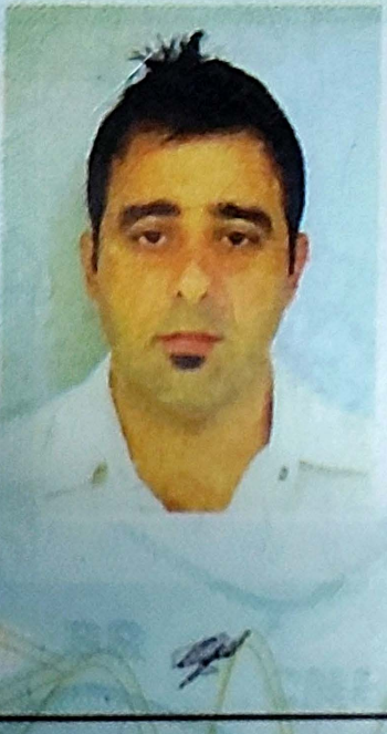
7 ASSINATURA DO PORTADOR