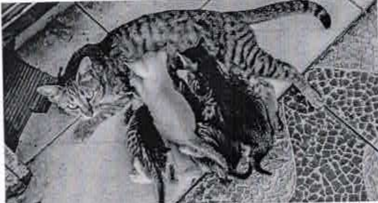
João Pessoa. Os mercuriais públicos e o campus da Universidade Federal estão entre os locais onde maior número de cães e gatos de rua

É o valor que pode custar a castração de um cão, segundo a coordenadora da ONG Bicho a Bessa. Com desconto dos veterinários parceiros, a ONG consegue realizar o procedimento por valores entre R$ 300 e R$ 400. Nos felinos, o valor sem desconto é R$ 400, mas a Bicho a Bessa paga R$ 100 por animal.