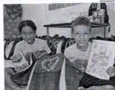
Assistência. Estudantes de João Pessoa recebem material escolar

A LBY, com sua unidade no Bairro de Jaguaribe, desenvolveu atividades em serviços de convivência e fortalecimento de vínculos, Criança Futuro no Presente,