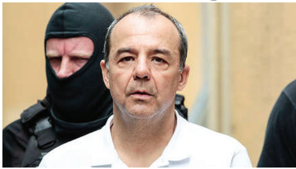
Entrega de bens. Acordo de colaboração premiada não tem previsão de devolução de recursos

mento, 13 condenações no âmbito da Lava Jato do Rio de Janeiro. Somadas, as penas superam os 280 anos.