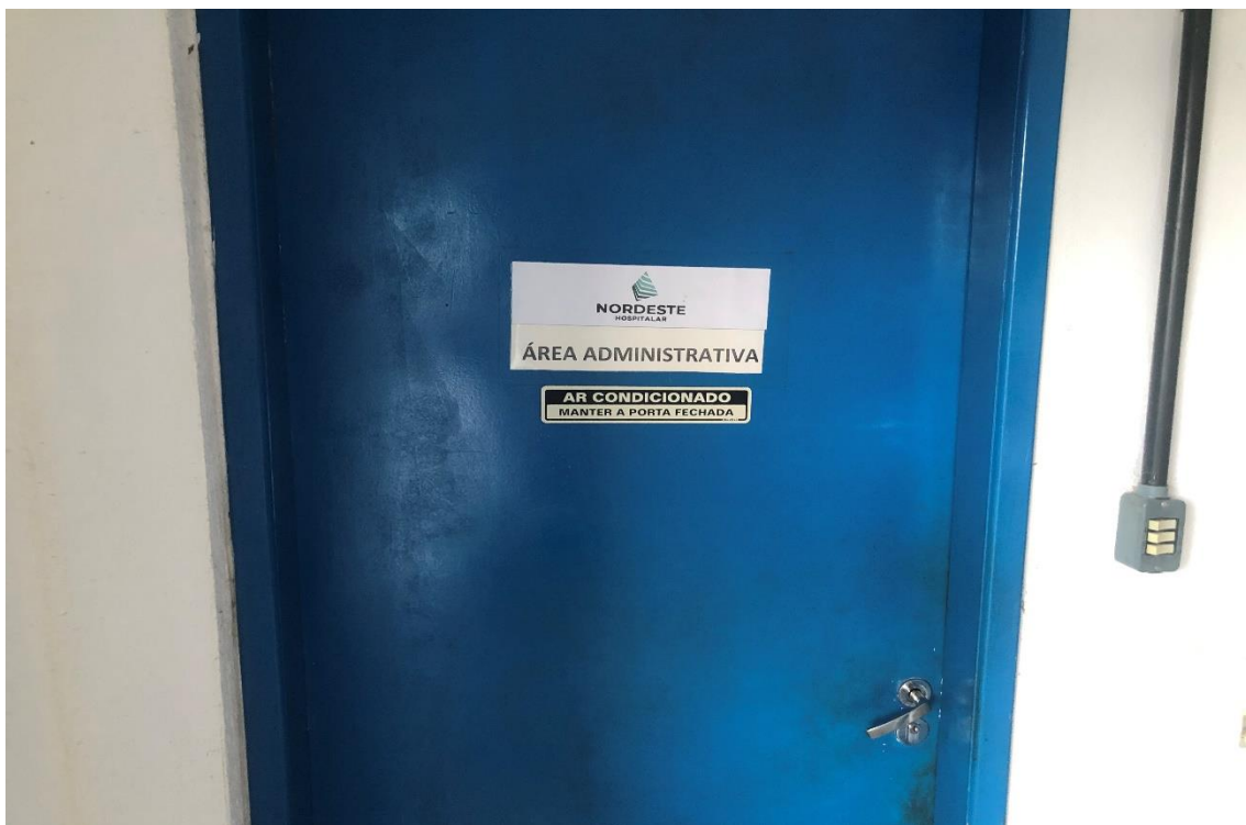
Foto: entrada do escritório da empresa Nordeste Hospitalar