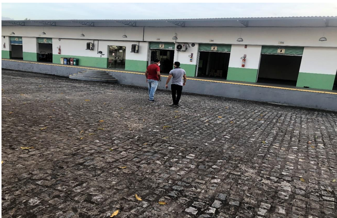
Foto: frente da empresa Nordeste Hospitalar