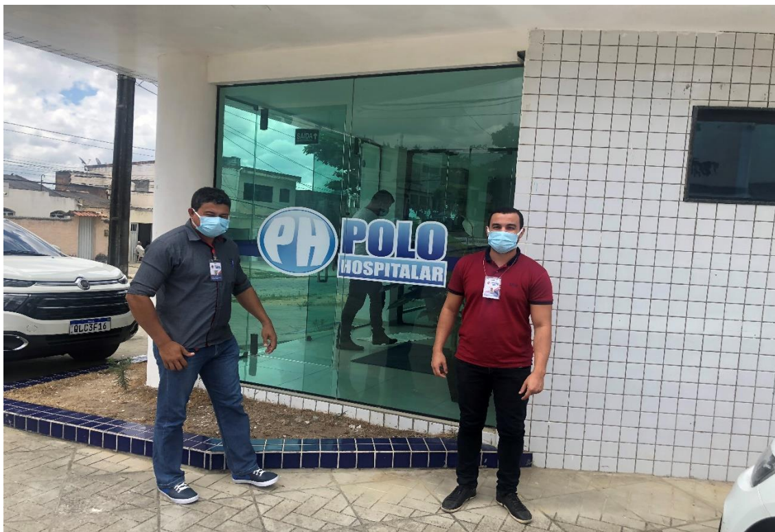
Foto: frente da empresa Polo Hospitalar