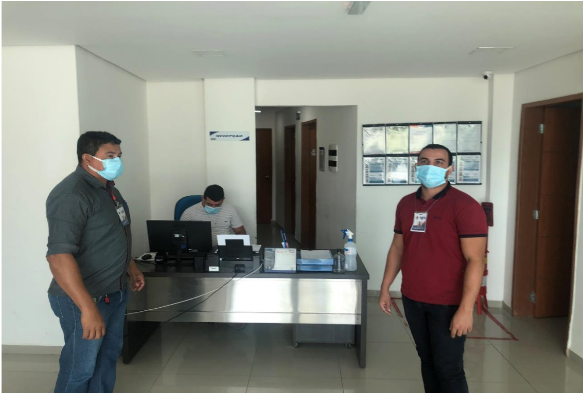
Foto: escritório da empresa Polo Hospitalar