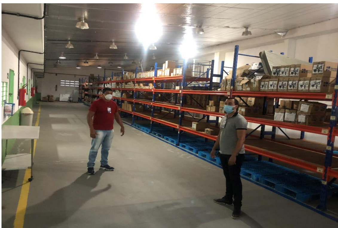
Foto: estoque da empresa Nordeste Hospitalar