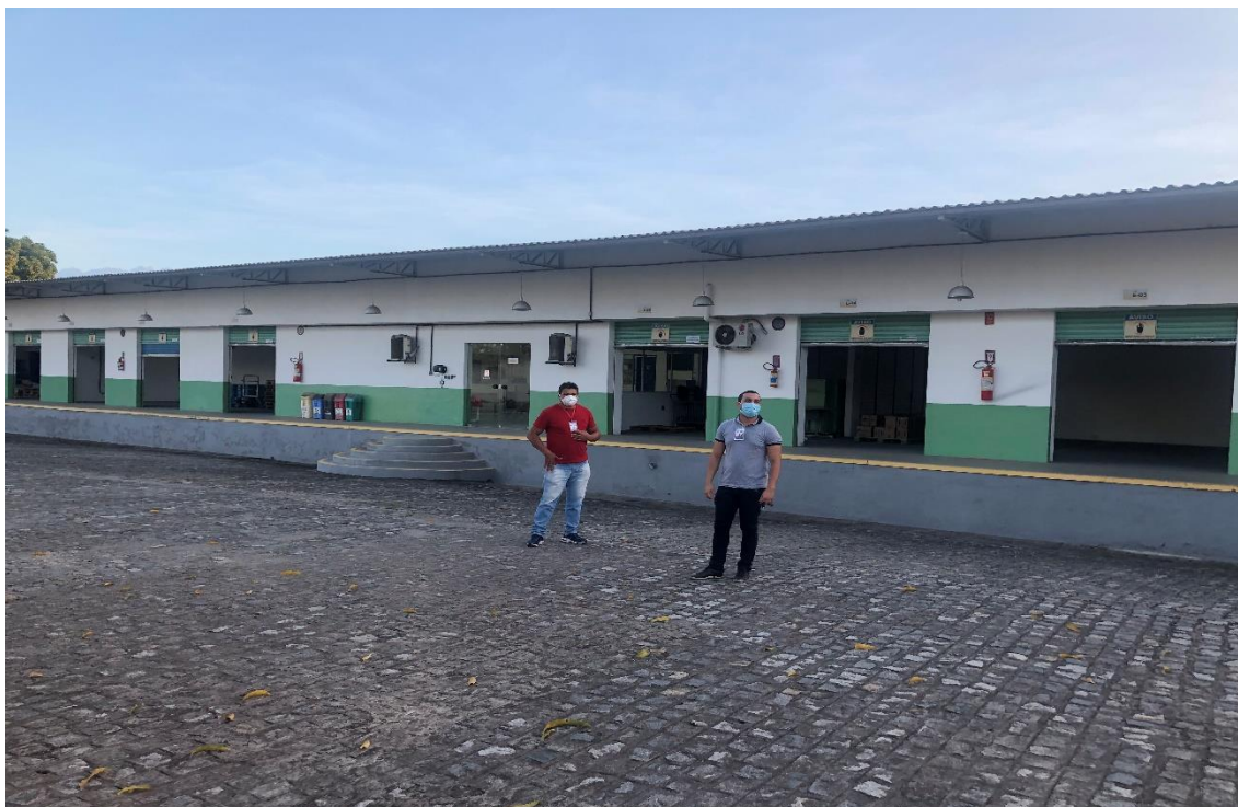
Foto: frente da empresa Nordeste Hospitalar