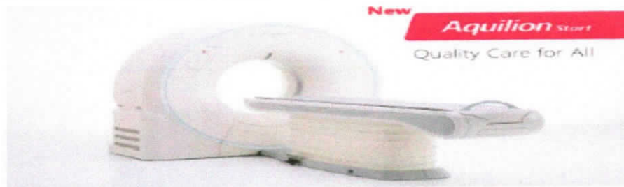
Figura 1 - Citação do tubo de 2 MHU da marca Canon e modelo Aquilion Start.

Todos os controles de mesa e gantry encontram-se em ambos os lados do equipamento. A ampla abertura de gantry de 75 cm , a maior do mercado, e os 47 cm de largura da mesa garantem o conforto e a facilidade de posicionamento mesmo para os maiores pacientes. A mesa suporta 220 kg e alcança uma altura mínima de 112 mm para facilitar o posicionamento de pacientes acamados/debilitados e crianças/idosos. Todos os comandos de posicionamento mecânico podem ser operados confortavelmente do console.