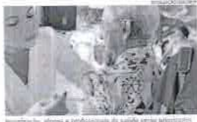
Imunização, idosos e profissionais de saúde serão priorizados

Programação. Inicialmente, serão imunizados idosos e trabalhadores de saúde. A vacinação para a população infantil será em horários específicos em turnos da tarde. Já os que não foram em unidades de longo permanência serão vacinados no próprio local, assim como as pessoas comorbadas, em seus residências. Os trabalhadores de saúde de saúde que atuam em instituições terão vacinação